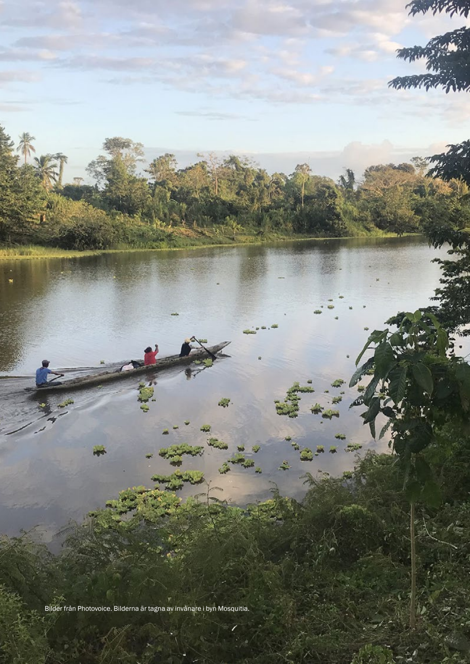
Bilder från Photovoice. Bilderna är tagna av invånare i byn Mosquitia.